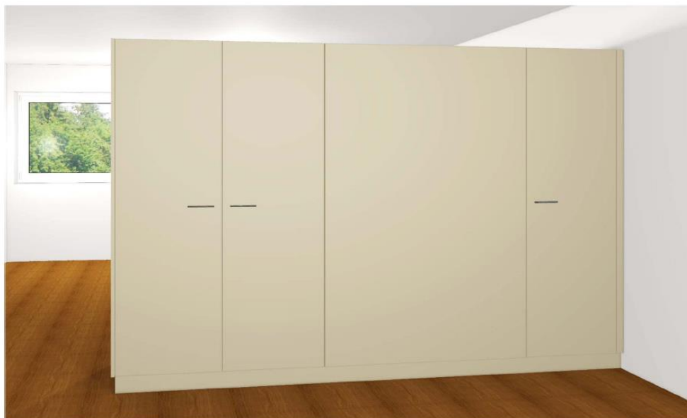
Rückseite Küche Gartenwohnung UG (Garderobe/Putzschrank)