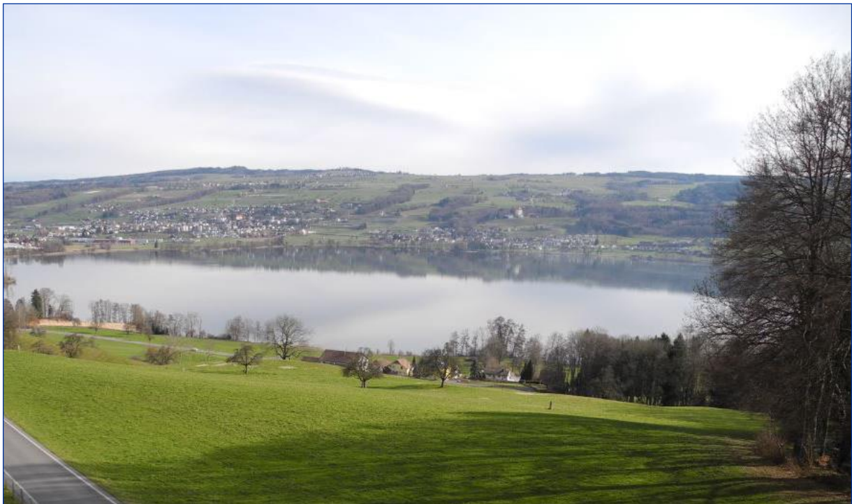
Aussicht auf den Baldeggersee

nach den neuesten elektrobiologischen Kenntnissen gebaut